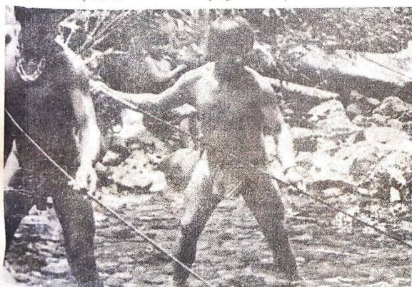
Los indígenas motilonos, hábiles pescadores y cazadores, han ido perdiendo su fiera batalla contra el empuje