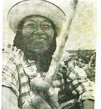
Un gesto de mujer guajira logrado mientras su familia (desembarcada en busca de un pedazo de tierra que no estuviera calcinada por el sol. El indio aún vive como en el siglo pasado, sin asistencia ni facilidades para superarse su nivel.